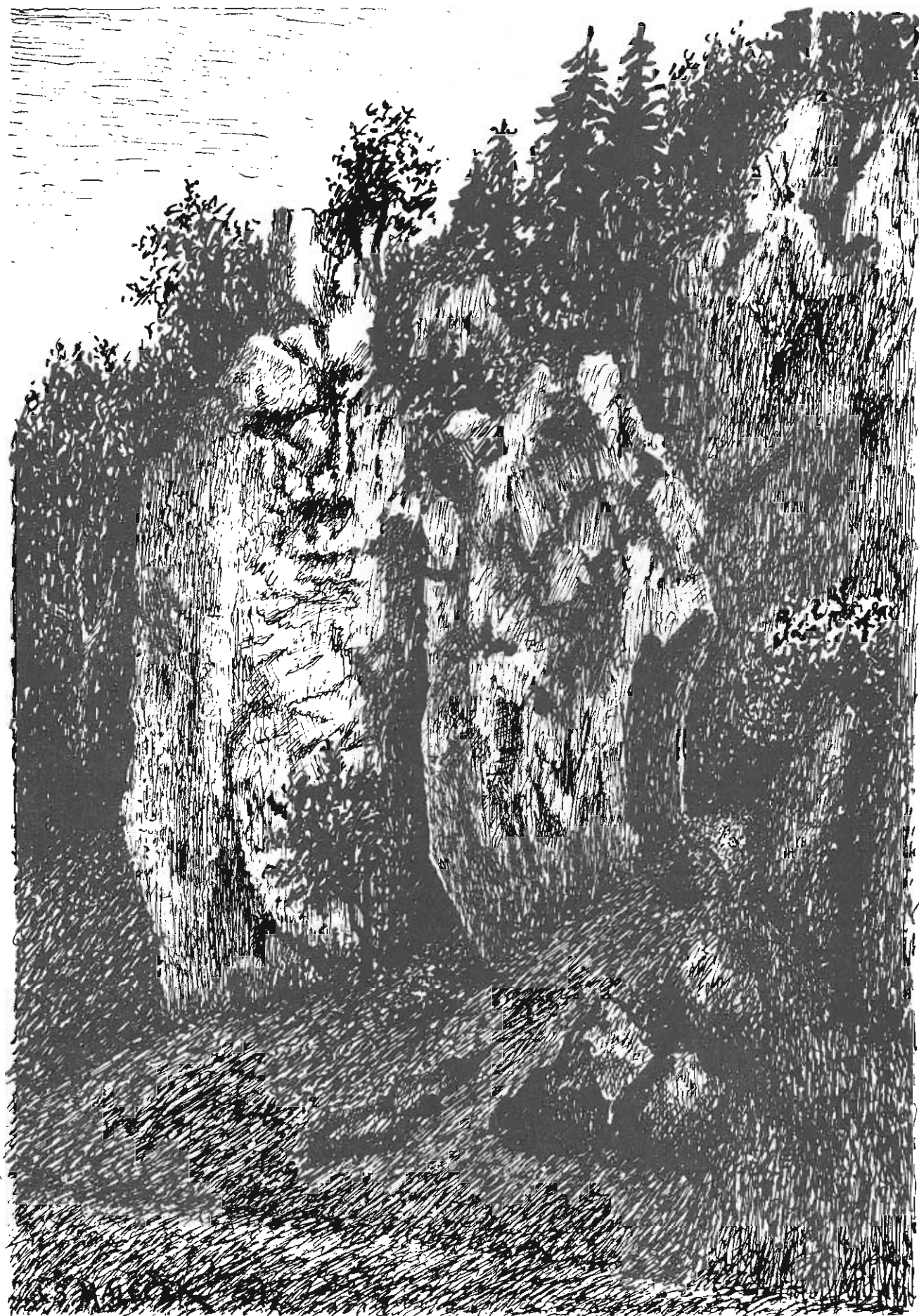
J.Š.Maleček: Skalní útvary - Indie, Evropa u Sloupských jeskyní