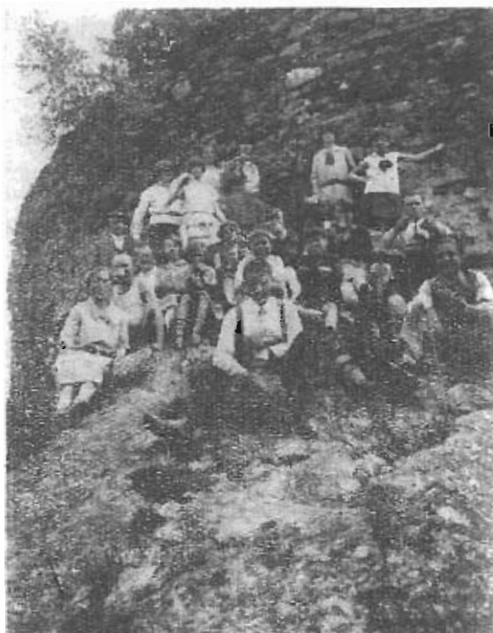
JEDNOTA PROLETÁRSKÉ TĚLOVÝCHOVY ADAMOV - 2. o.