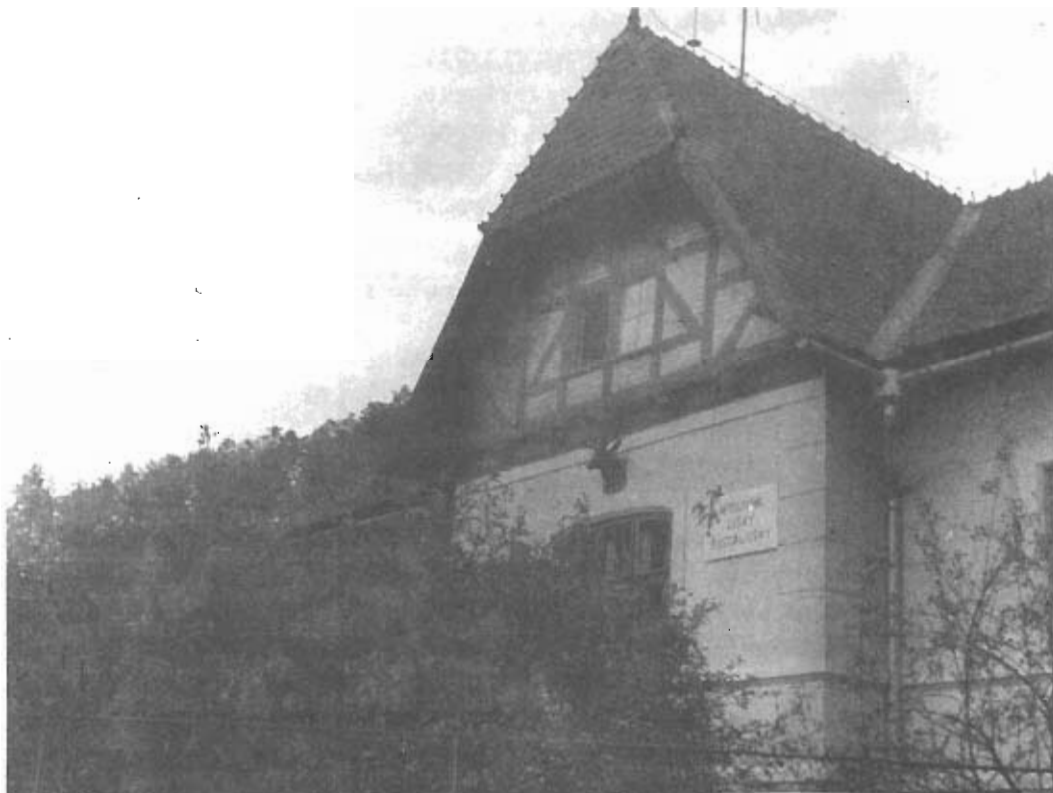
" Myšlivna lišky Bystroušky " v Palackého údolí u Bílovic n. Svit.