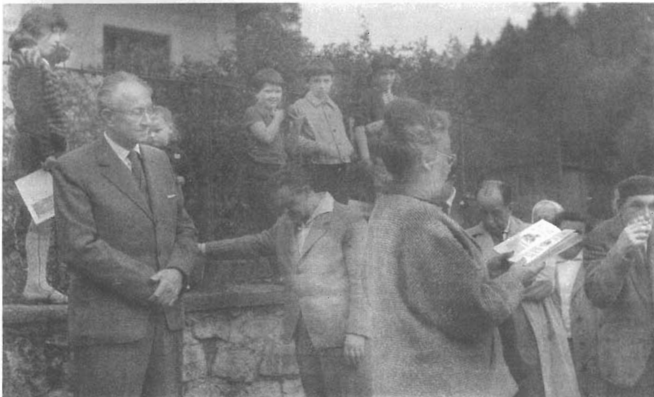
Záběr z odhalení pamětní desky " Myslivna lišky Bystroušky " na hájence v Palackého údolí u Bílovic n. Svit.