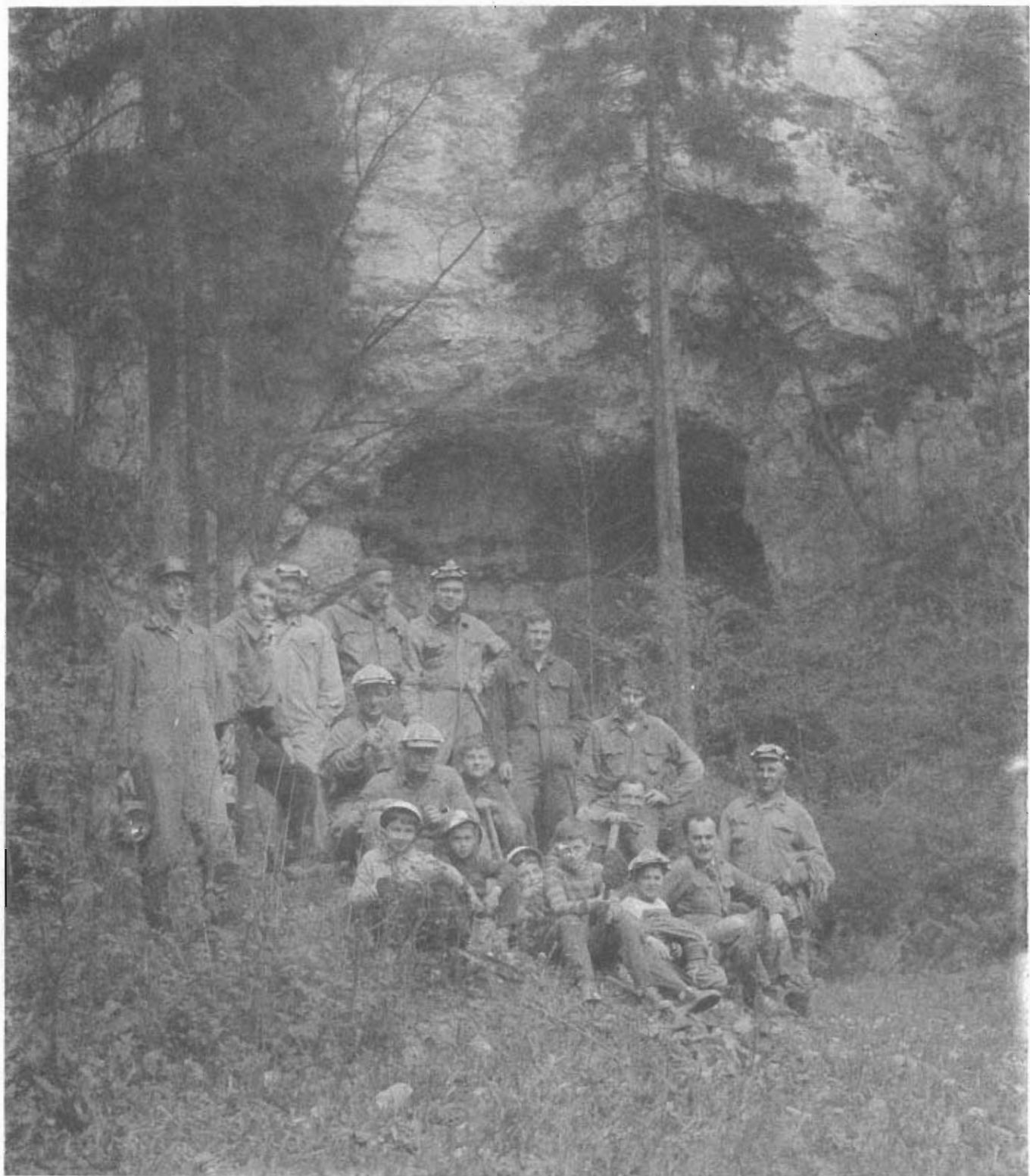
Členové speleologického kroužku ZK - ROH ADAST před svým pracovištěm Býčí skálou - 1965