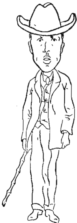
Karel Čapek na procházce (autokarikatura)